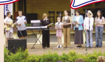
Přehlídka duchovních písní „Cantate Luhačovice“