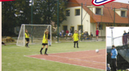
Malá kopaná Veselí nad Moravou

Členství v Orlu je dobrovolné, členem Orla se může stát každý, kdo souhlasí s cíli Orla a jeho stanovami.