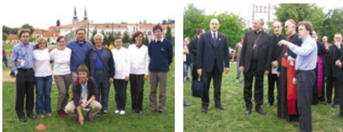
Soutěž ve fotbalových dovednostech pod záštitou Antonína Panenky na Velehradě navštívil v roce 2007 i kardinál Tarcisio Bertone

Mariánské náměstí 78 686 01 Uherské Hradiště e-mail: zupa.velehradska@quick.cz tel.: 572 553 583