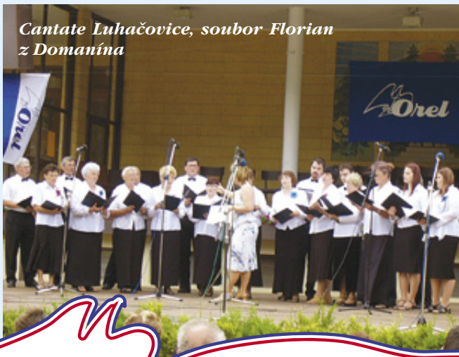
Cantate Luhačovice, soubor Florian z Domanína